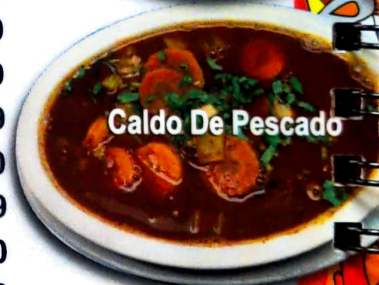
Caldo De Pescado