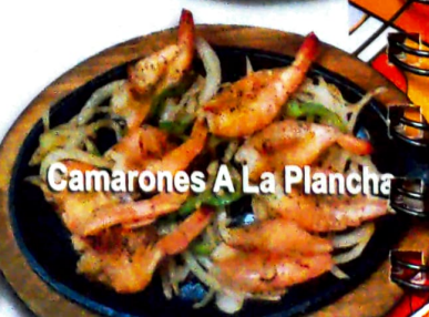
Camarones A La Plancha