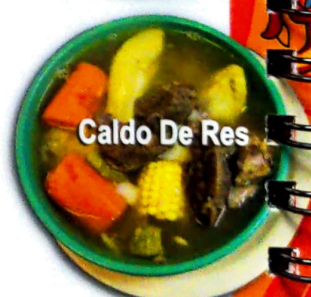
Caldo De Res