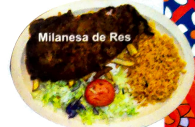
Milanesa de Res