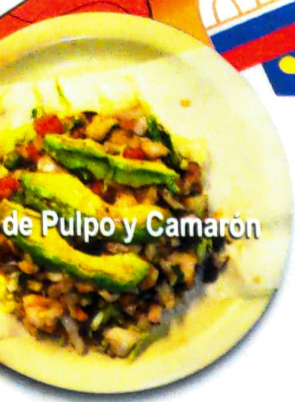
de Pulpo y Camarón