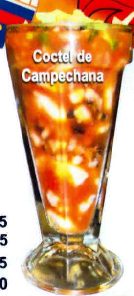
Coctel de Campechana