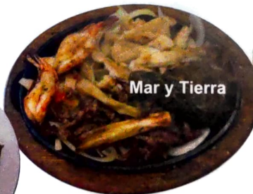
Mar y Tierra