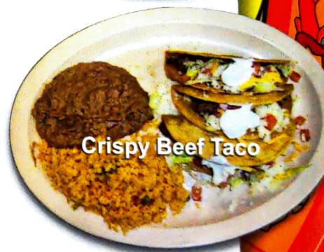
Crispy Beef Taco