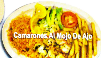
Camarones Al Mojo De Ajo