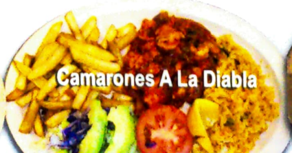
Camarones A La Diabla