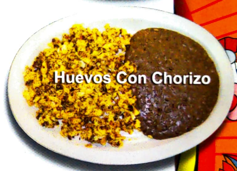
Huevos Con Chorizo