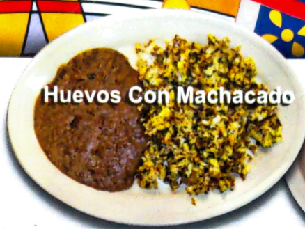
Huevos Con Machacado