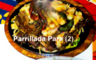
Parrillada Para (2)