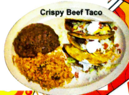
Crispy Beef Taco