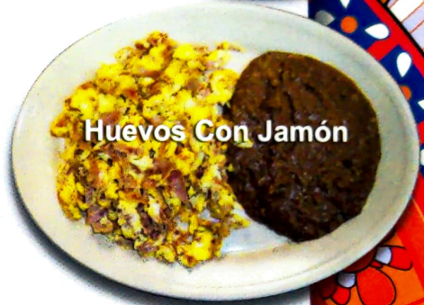
Huevos Con Jamón